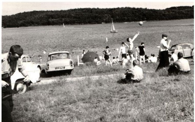
Zwemmen in het meer van Neuvic

Met als resultaat dat ik nooit meer last van ze heb gehad. Inmiddels wel liefhebber van Wijn en Pernod geworden.